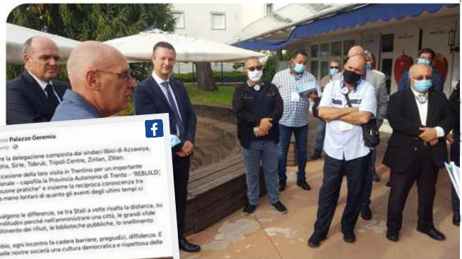
«Rebuild» (capofila la Provincia autonoma di Trento) una delegazione di dieci sindaci di MondoMelinda e alcune realtà del Consorzio formato da quattromila soci che, a Zliten, in Libia, ha un centro di servizi. I sindaci di Non e di Sole.

Nel tardo pomeriggio di ieri si è tenuta l'incontro con i vertici della Federazione Trentina della Cooperazione e del Consorzio Melinda