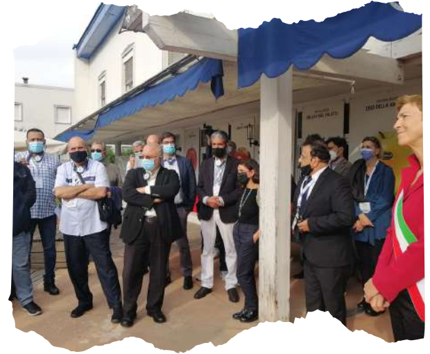
فال دي نون - MondoMelinda