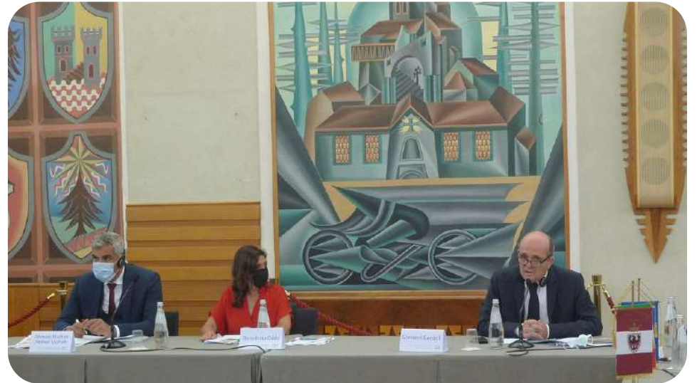
ترينتو، صالة "ديبيرو" - الاجتماع الافتتاحي