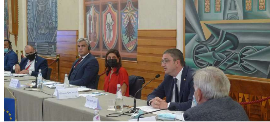
ترينتو، صالة "ديبيرو" - الاجتماع الافتتاحي