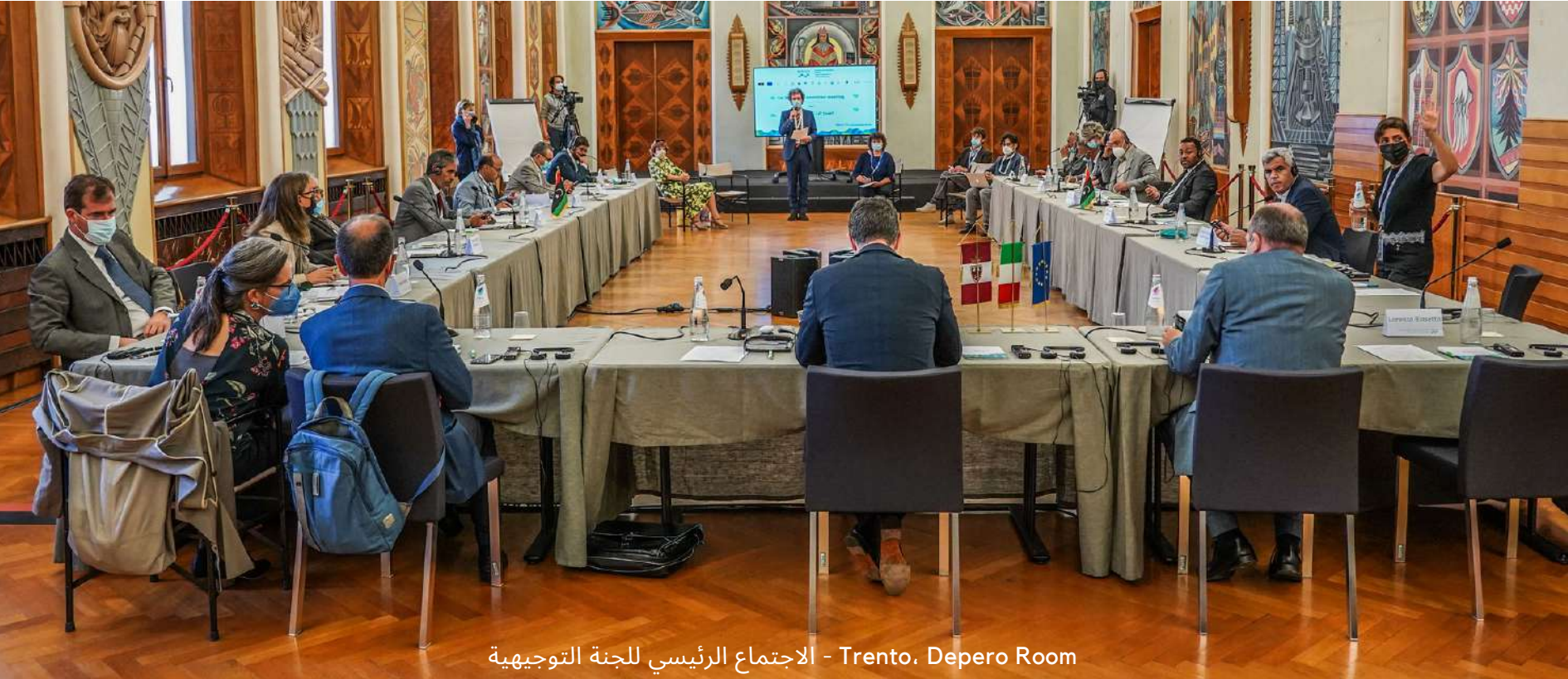
Trento, Depero Room - الاجتماع الرئيسي للجنة التوجيهية

في الصباح الاجتماع الرئيسي للجنة التوجيهية لمناقشة واعتماد وثائق عمل مشروع REBUILD الرئيسية